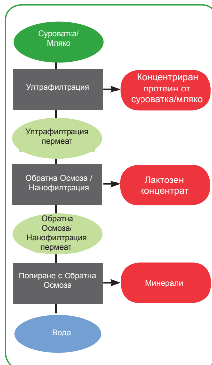
APV SepStream обработка на суроватка и мляко

Обратната осмоза или Нанофилтрацията, използвани за концентриране и частично деминерализиране на суроватка и пермеат след Ультрафилтрация, води до производство на продукти без въздушни примеси (удобни за транспортиране). Допълнителното третиране с Обратна осмоза дава производство на висококачествена омекотена вода, която може да се използва като технологична или за ЦИП.