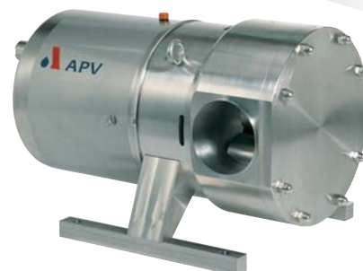
Die größte Verdrängerpumpe der Welt

Die DW7 ist aktuell die größte Verdrängerpumpe auf dem Markt.