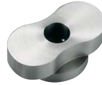
Zwei verschiedene Rotoren stehen zur Verfügung: Drehkolben- und Kreiskolbenrotoren