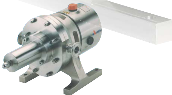
EHEDG-zertifiziertes DW Überströmventil

Der Standardwerkstoff der Rotoren ist Edelstahl der Güte AISI 316 L (1.4404), optional sind aber auch Rotoren aus NGA (abriebfesten Legierungen) lieferbar.